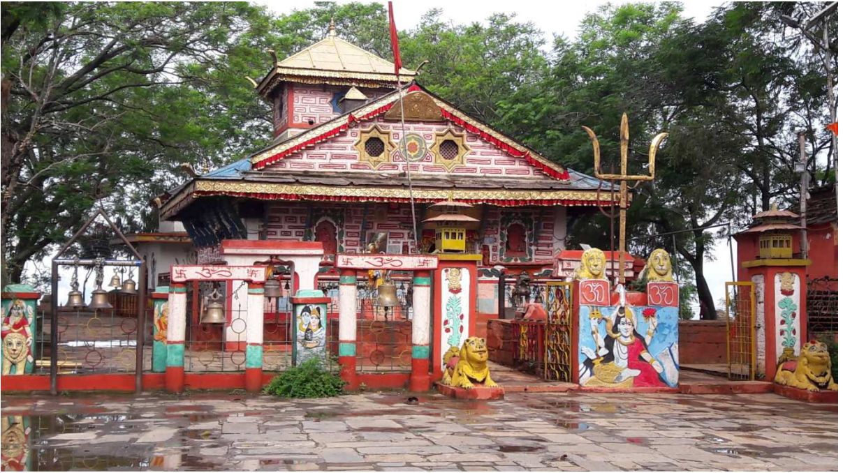
-शैलेश्वरी मन्दिर, सिलगढी, डोटी